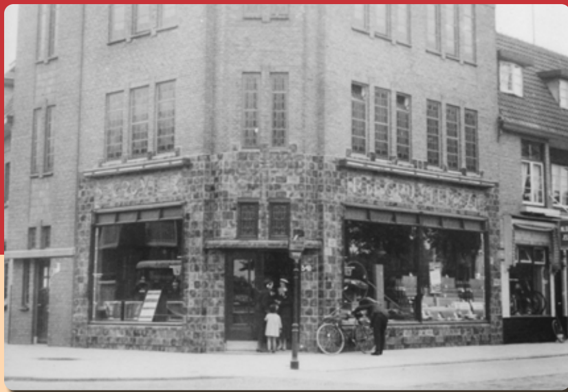
TEKST WIM VAN SCHARENBURG