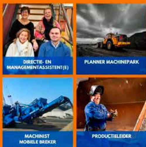
DIRECTIE- EN MANAGEMENTASSISTENT (E)

Meer weten? Neem dan een kijkje op onze website(s): www.theopouw.nl en www.werkenbijtheopouw.nl